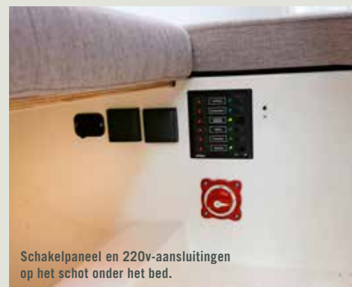
Schakelpaneel en 220v-aansluitingen op het schot onder het bed.

Ontwerp: Alexander Vrolijk. www.judelenvrolijk.com Bouw: Bente GmbH / Yachtservice Szczecin. www.bente24.com Leverancier Benelux: Sailcentre Makkum. De Steinplaat 9a 8754HE Makkum, 0515 232355 info@sailcentremakkum.nl www.sailcentremakkum.nl