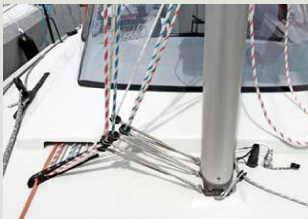
De scherpe hoeken in de valgeleiding leveren veel wrijving op.