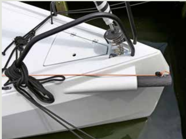
Scepters en preekstoel zijn van geanodiseerd aluminium.