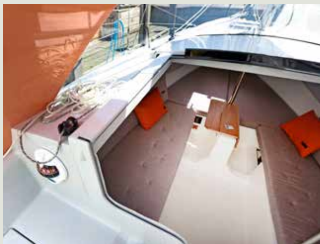
Stahoogte onder de buiskap.