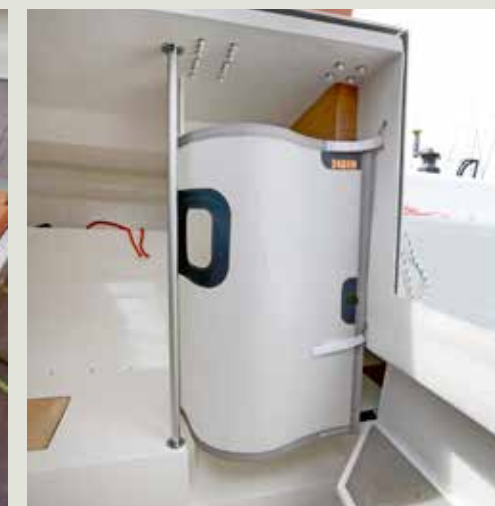
Privacy op de pot verkrijg je met een stuk zeildoek.