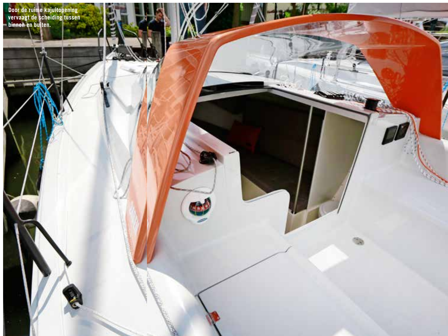
Door de ruime kajuitopening vervaagt de scheiding tussen binnen en buiten.