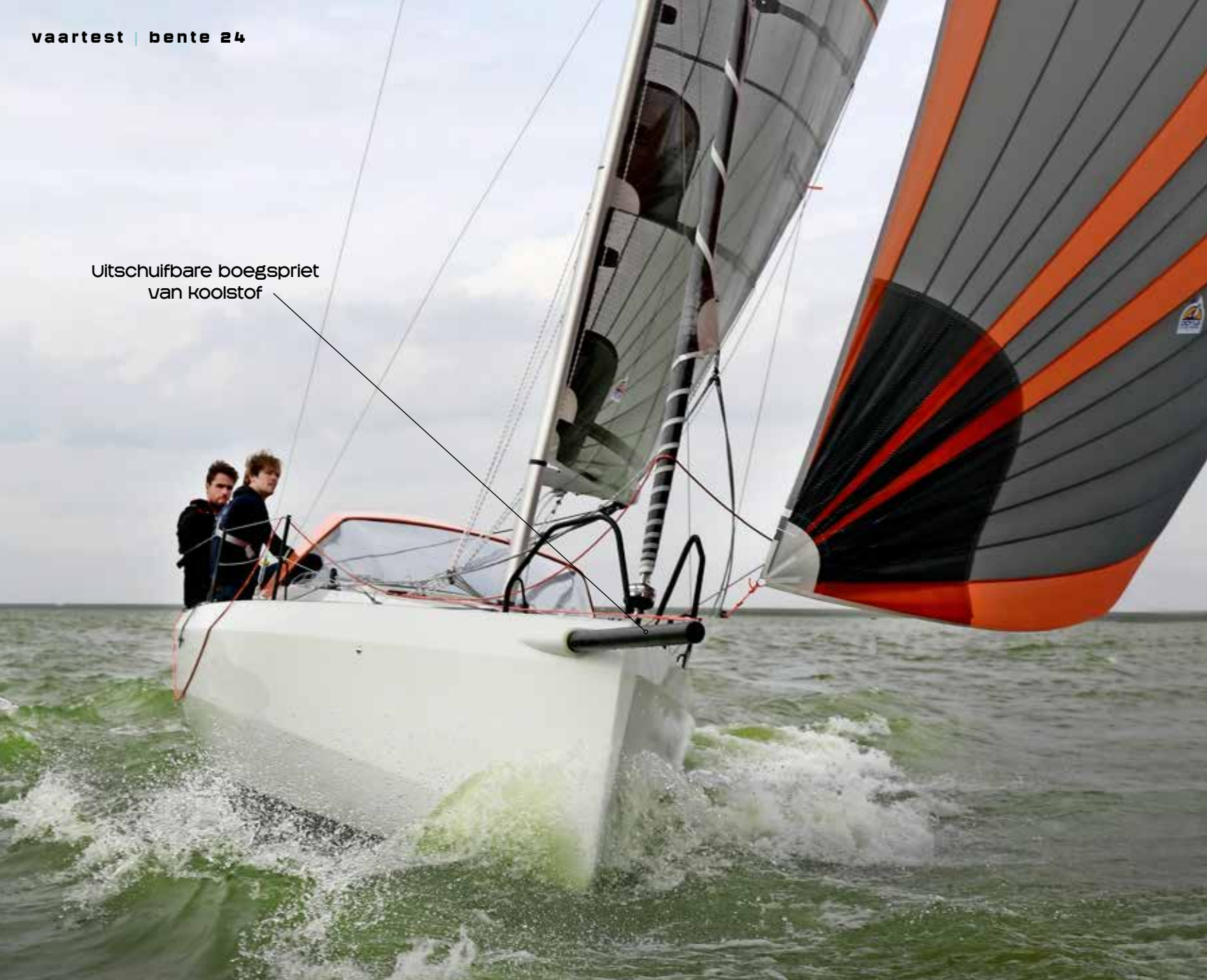
Uitschuifbare boegspriet van koolstof