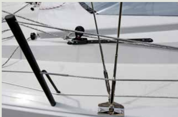
Het want grijpt aan op de flens.