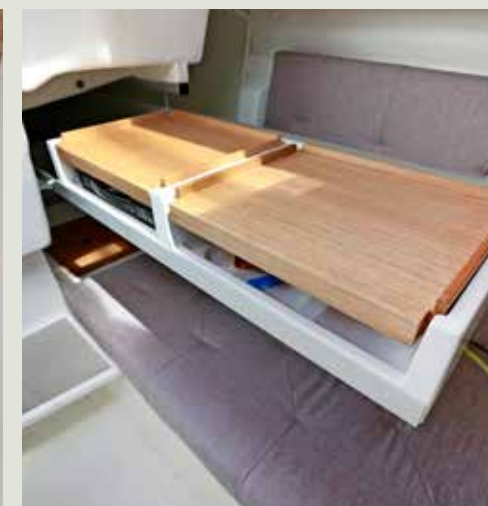
Inschuifbaar kombuis: werkbladen en een alcoholbrander.