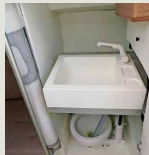
De afvoer van de spoelbak hangt in de toiletpot.