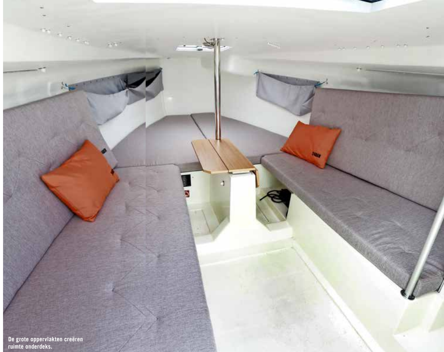
De grote oppervlakten creëren ruimte onderdeks.

Na 475 dagen is de romp klaar – en dat niet alleen. De boot, die inmiddels Bente 24 is gaan heten, is al meerdere malen besteld en een serieproductie is in gang gezet. 'Er is zelfs een motorbootvaarder die de z'n boot gaat inwisselen voor een Bente, dus daarmee is onze doelstelling om de wereld vanaf het water te redden ook weer dichterbij gekomen!', schrijft Boden op de Duitse zeilwebsite segelreporter.de. Bente 24 is zoals de naam het al zegt 24 voet geworden, heeft tal van interessante eigenschappen die de vlotheid bevorderen, maar niks te extreem, is verkrijgbaar in CE-C, maar ook in -B keur, is overzichtelijk en simpel ingericht zowel aan dek als onderdeks, ziet er bijzonder uniek uit met de vaste buiskap en de naar binnen invallende knik in de bovenste huidgang en wordt modulair geleverd. Ook kun je er langgestrekt in slapen met vier personen, recht op in koken aan een uitschuifbaar keukenblad en comfortabel zitten op de pot. Het bouwproces is openlijk verlopen, waardoor lezerswensen zoals een zwemplatform, een dichte spiegel, stahoogte, toilet, eenzovoorts, en ontwerpsuggesties van studenten van de hogeschool Hannover het de bouwers nog lastig maakten om de prijs laag te houden. Toch lijkt dat met de vanaf- en tevens zeilklaare prijs van 25.000 euro gelukt. Het lijkt er op dat Vrolijk en Boden hun beloftes aan hun lezers hebben waargemaakt. We nemen de proef op de som